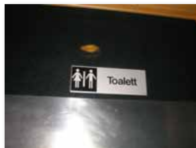
Skyltarna till toaletterna har god kontrast mellan text och bakgrund. Däremot sitter de ofta något högt och är utan vare sig punktskrift eller upphöjd relief.