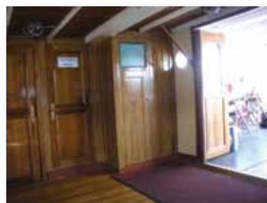
Trafikdisplayen vid entrén på Norrskär är insprängd i väggen och sitter på en nivå som gör den läsbar även på mycket nära håll (något för hög).